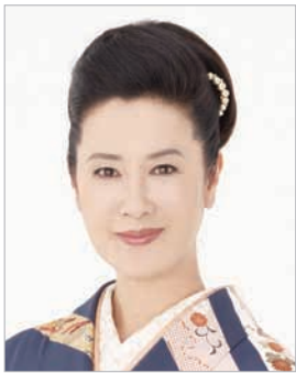
名取 裕子 NATORI Yuko

※5月20日(火)までにお申込みください。以降は電話にて承ります。 ※未就学児のご入場はご遠慮ください。