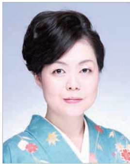
大谷 祥子 OTANI Shoko

青山学院大学文学部日本文学科卒業。1977年、TBSテレビ小説「おゆき」のヒロインでデビューし、以後、ドラマ・映画・CMと幅広く活躍。映画「序の舞」「吉原炎上」など数々の話題作に出演。「異人たちの夏」「マークスの山」で、日本アカデミー賞助演女優賞受賞。「法医学教室の事件ファイル」「葬儀屋松子の事件簿」「京都地検の女」など、人気のテレビドラマシリーズに主演。4月よりテレビ東京系連続ドラマ「マルホの女」が放送スタート。