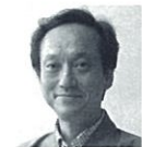
下出 祐太郎 京時絵師 京都産業大学教授

1932年生まれ。東大教養学部教養学科卒、71年東大文学部助教授、79年同教授、92年国立西洋美術館館長、02年大原美術館館長、2000年紫綬褒章、01年フランス・レジオン・ドヌール・シュヴァリエ勲章、05年文化功労者、12年文化勲章 <著書>「ピカソ：劇画の論理」「近代美術の巨匠たち」「日本近代美術史論」「日本近代の美意識」ほか。